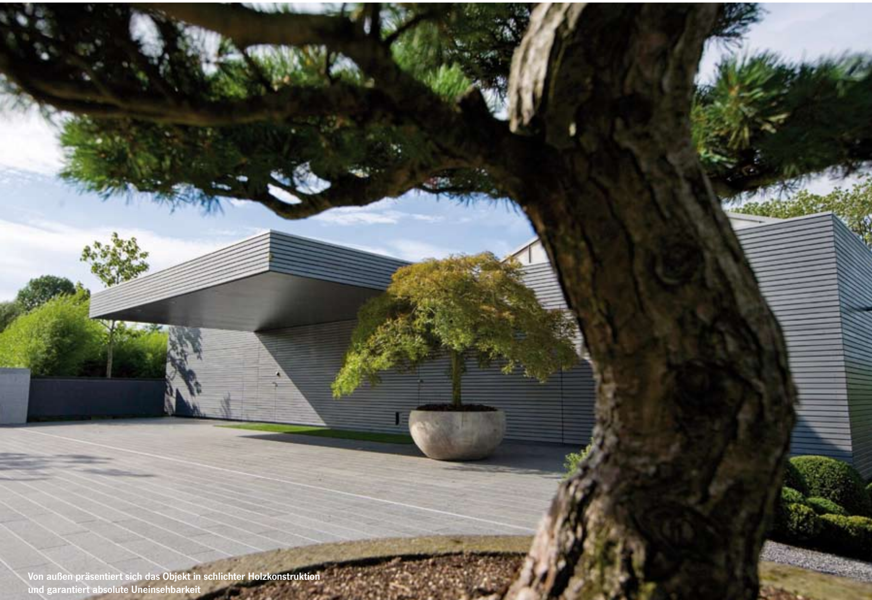
Von außen präsentiert sich das Objekt in schlichter Holzkonstruktion und garantiert absolute Uneinsehbarkeit